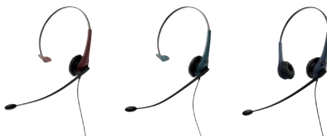
GN 2200 mono (rouge)